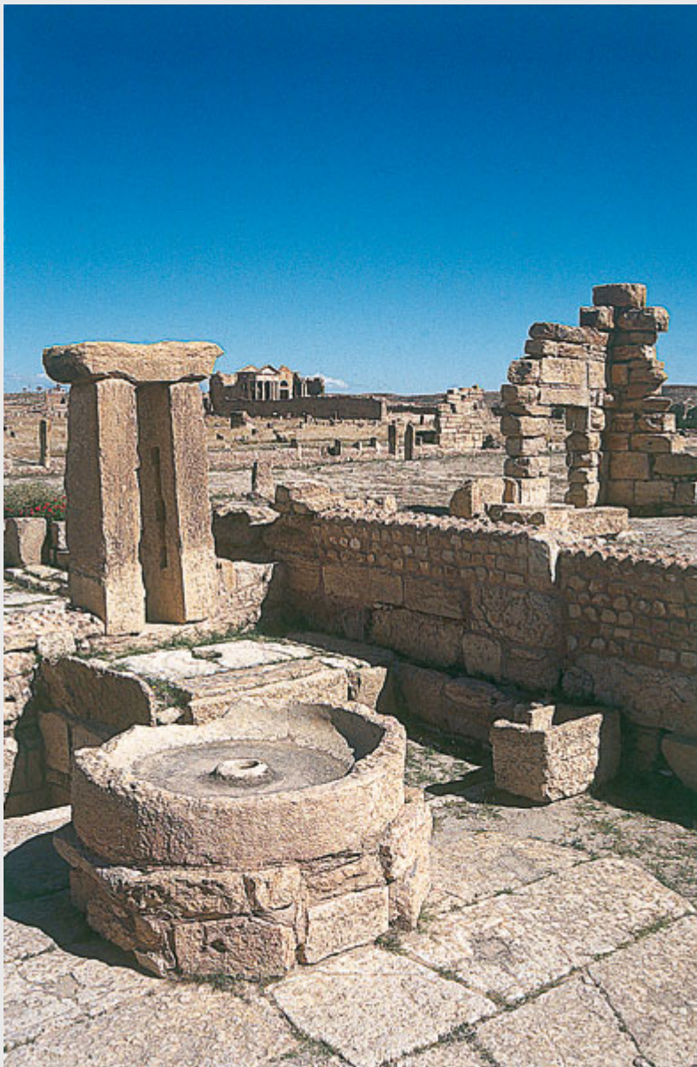
De nombreux restes de pressoirs à huile sont visibles sur les sites

Malgré les conquêtes des siècles suivants – vandale, byzantine puis arabe – l'huile d'olive resta reine en Tunisie. Sauf que c'est vers Kairouan que convergèrent désormais les revenus de "l'or jaune". Après la conquête arabe, des voyageurs émerveillés décrivent la Tunisie comme un pays couvert du nord au sud par une immense forêt d'oliviers. Au XIe siècle, le géographe Al-Bekri note : « Parmi les merveilles de Kairouan, on peut signaler l'importance de son oliveraie qui est exploitée en exclusivité pour les besoins de la ville en bois sans subir le moindre dommage. »