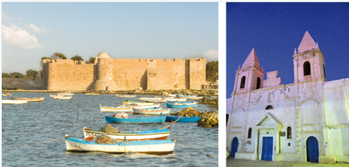
2. L'église de Houmt-Souk, construite en 1857 par la communauté maltaise de Djerba.