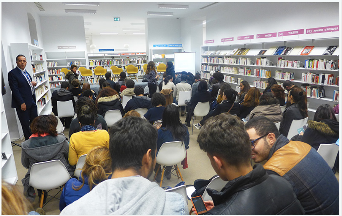
Hommage en dessin et en direct au patrimoine architectural de Tunis