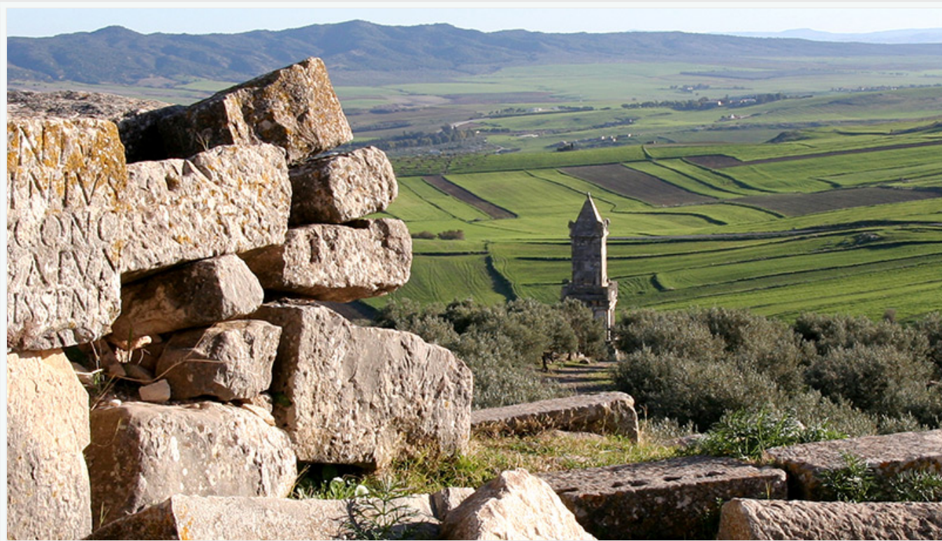
Dougga : le mausolée numide.