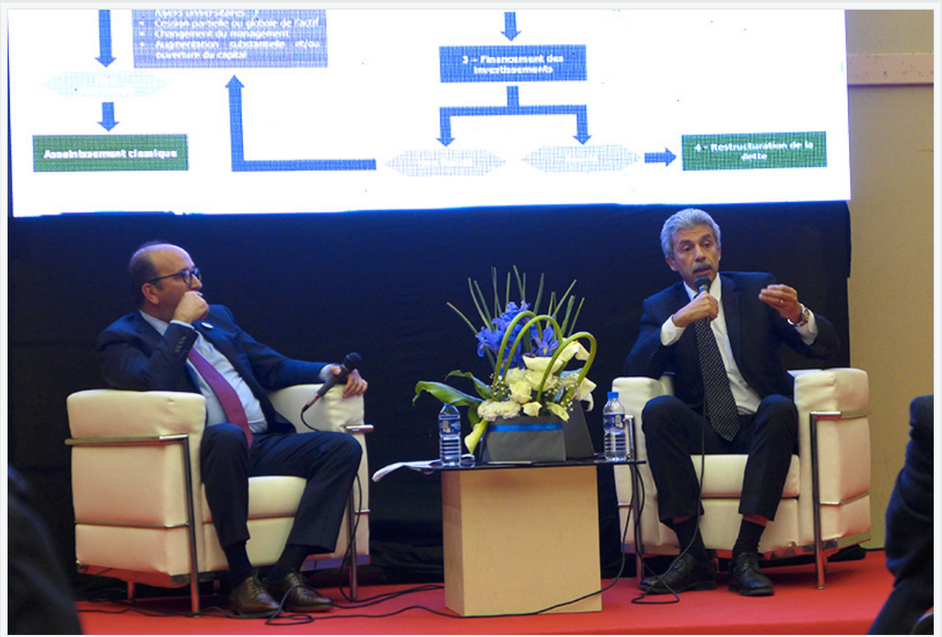
Le stand de la plateforme BtoB Oosafer