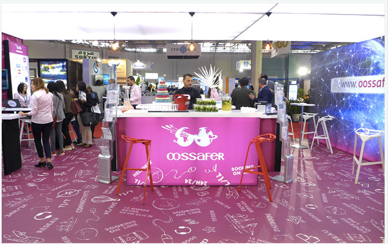
Le stand de Destination Dahar, antenne tunisienne de la fondation Swiss Contact