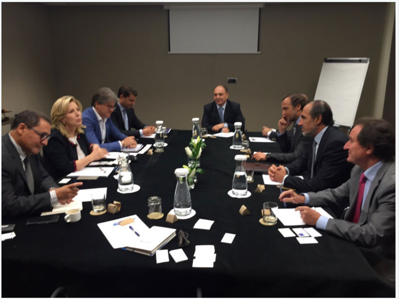
Avec le staff de l'OMT