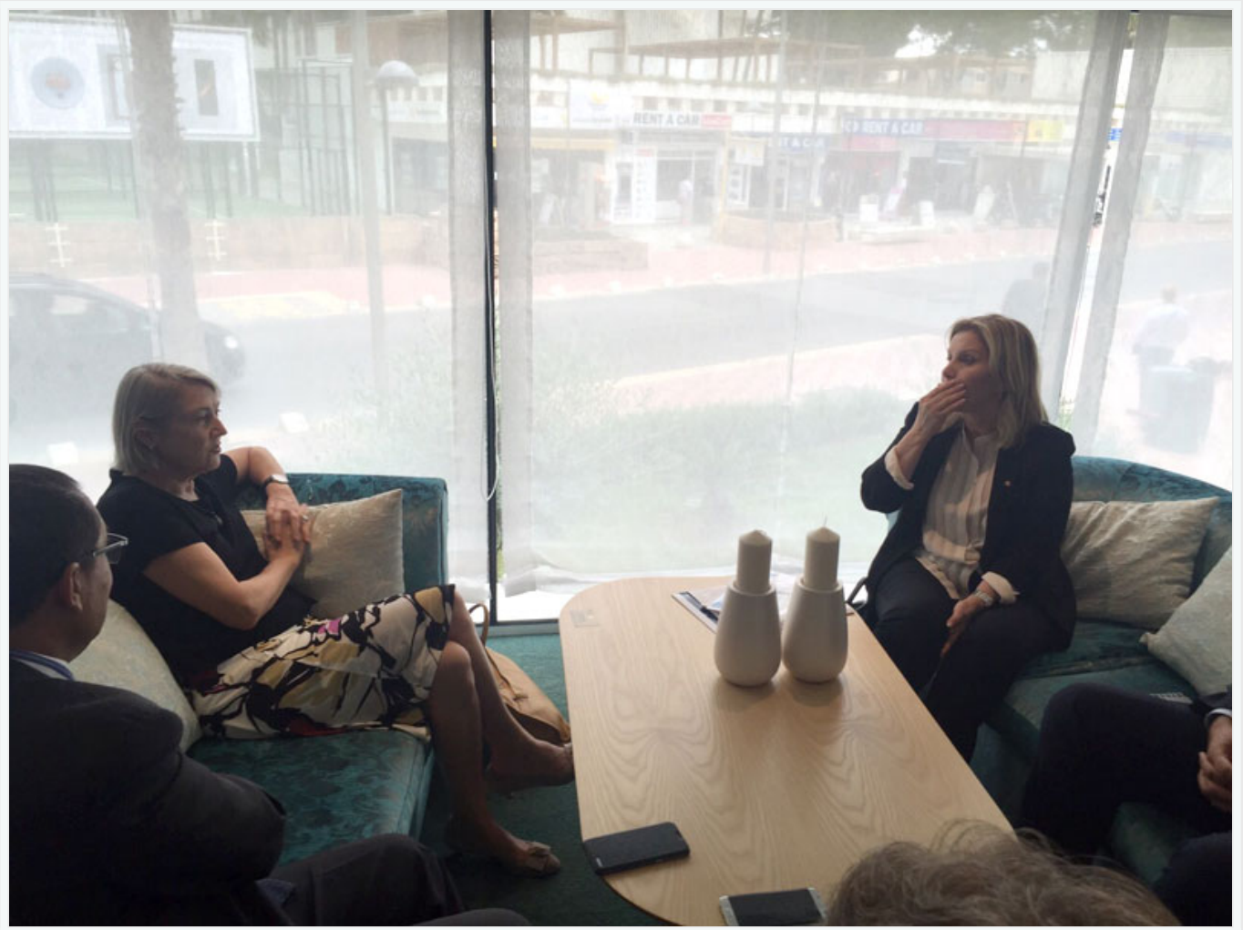
Avec le staff de Vincci Hoteles