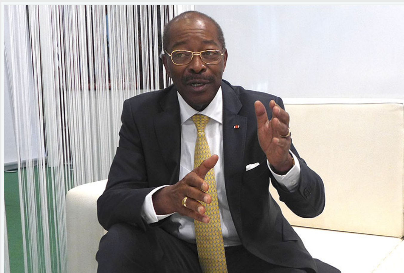
Roger Kacou, ministre du Tourisme de la Côte d'Ivoire