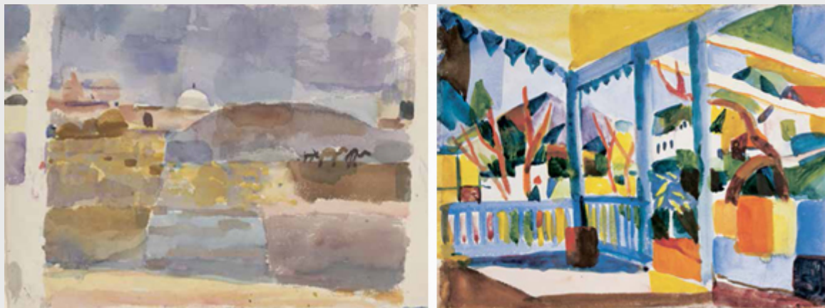
Paul Klee, vor den Toren von Kairuan, 1914. August Macke, Terrasse des Landhauses in St. Germain, 1914 (Saint-Germain est aujourd'hui Ezzahra). En haut : Paul Klee, « Mondaufgang (St Germain) », vers 1915.