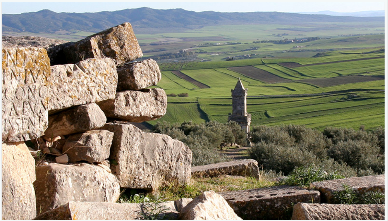
Dougga : le mausolée numide.