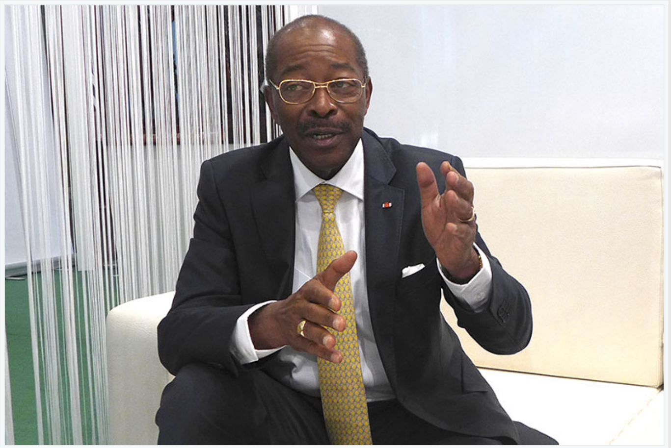
Roger Kacou, ministre du Tourisme de la Côte d'Ivoire