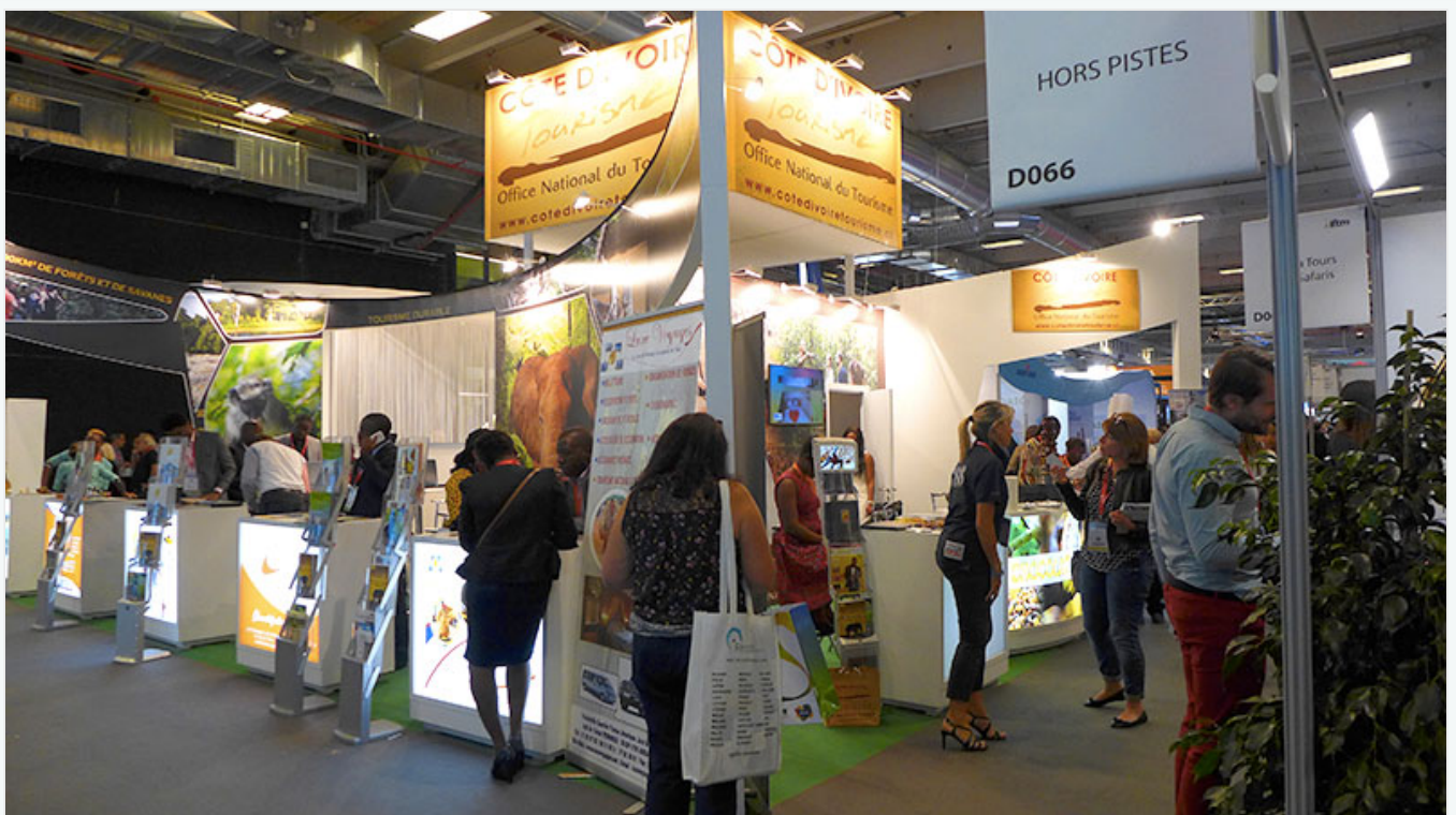
Le stand de la Côte d'Ivoire à l'IFTM-Top Resa