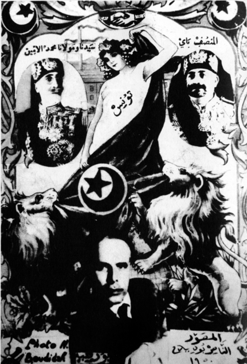
La femme et le drapeau, pour illustrer la marche vers l'Indépendance (document tiré de "Histoire de la Tunisie" par H. Boularès, éditions Cérès).