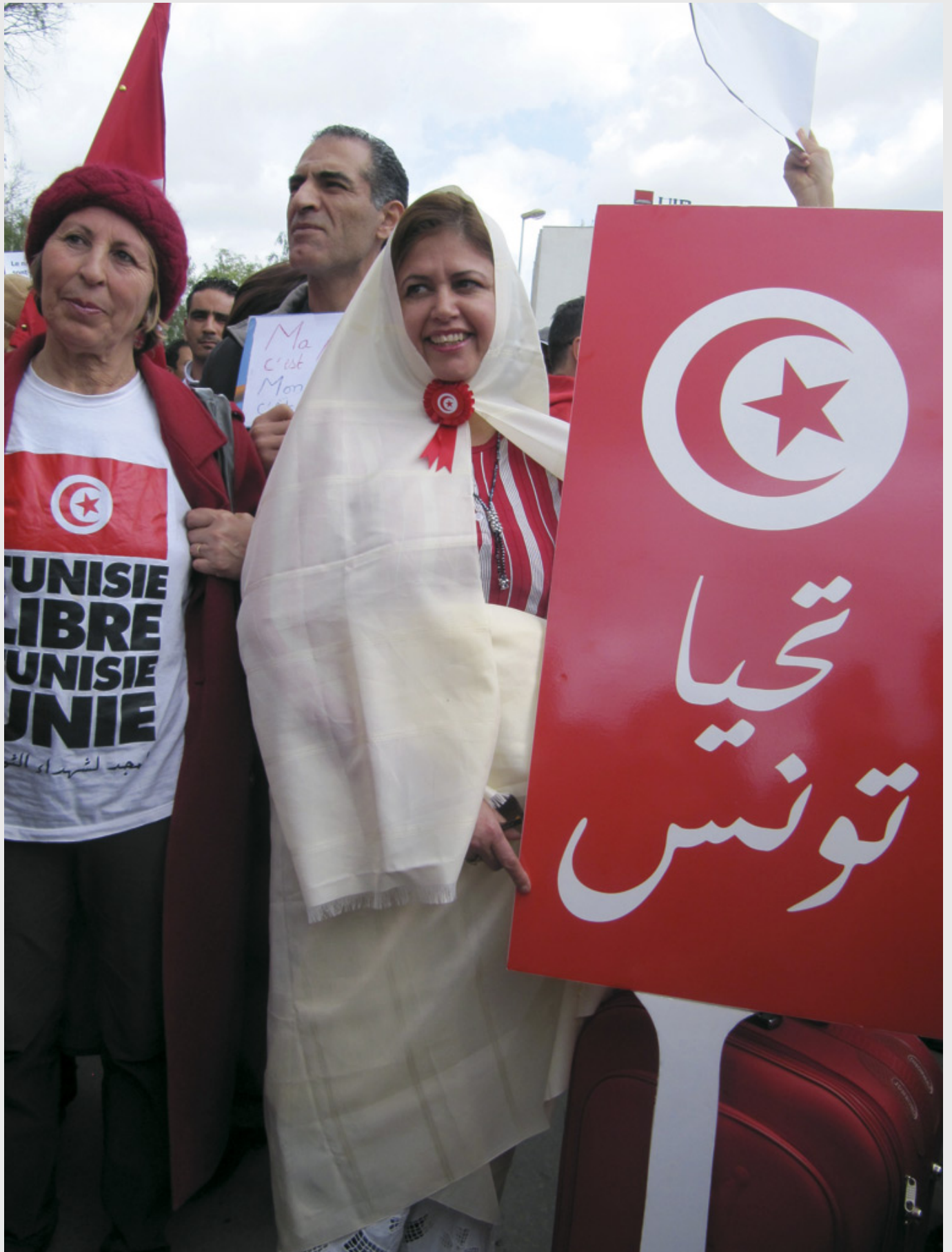
Des Tunisiennes célèbrent la Journée Internationale des Femmes, le 8 mars