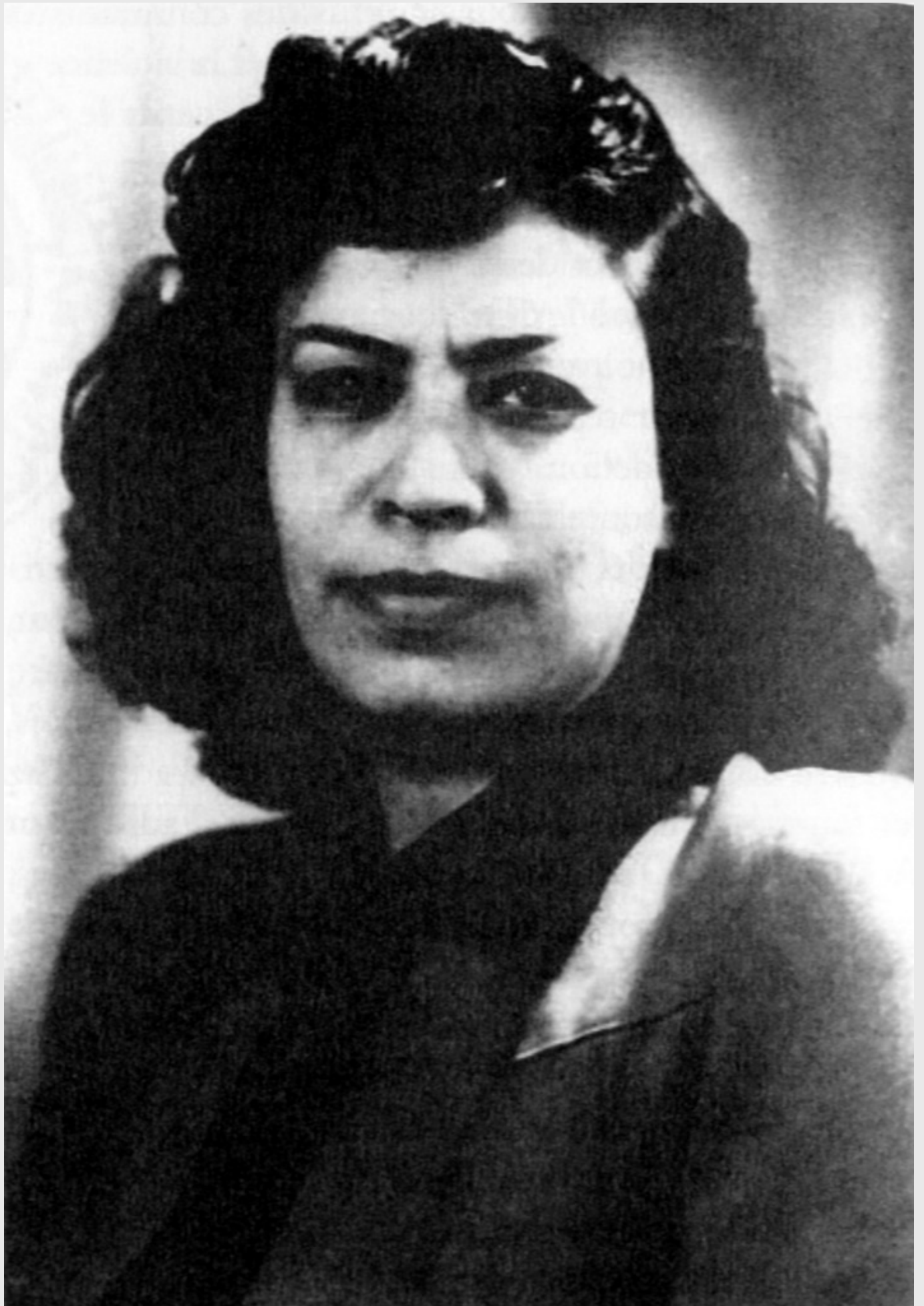
Issue d'un milieu religieux, elle voulait promouvoir l'instruction des jeunes