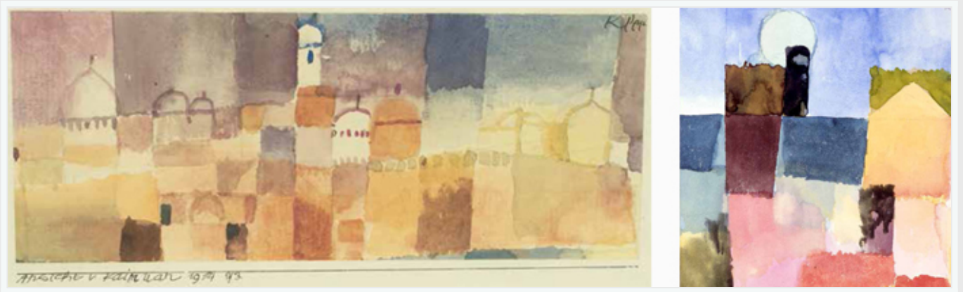
Parmi les aquarelles peintes par Klee en Tunisie : Kairouan et St Germain près de Tunis (aujourd'hui Ezzahra)