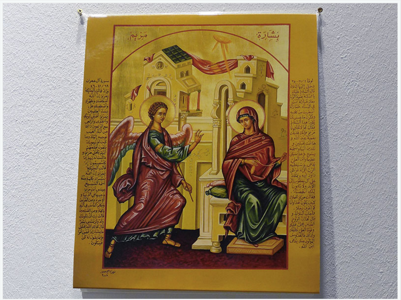
Mosquée de Chenini, un des lieux où est commémoré le mythe musulman et chrétien des Sept Dormants/Ahl el-Kahf