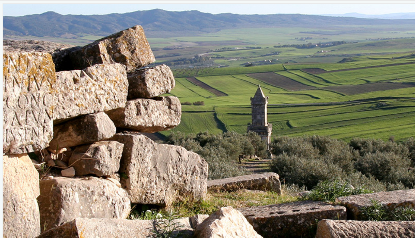
Dougga : le mausolée numide.