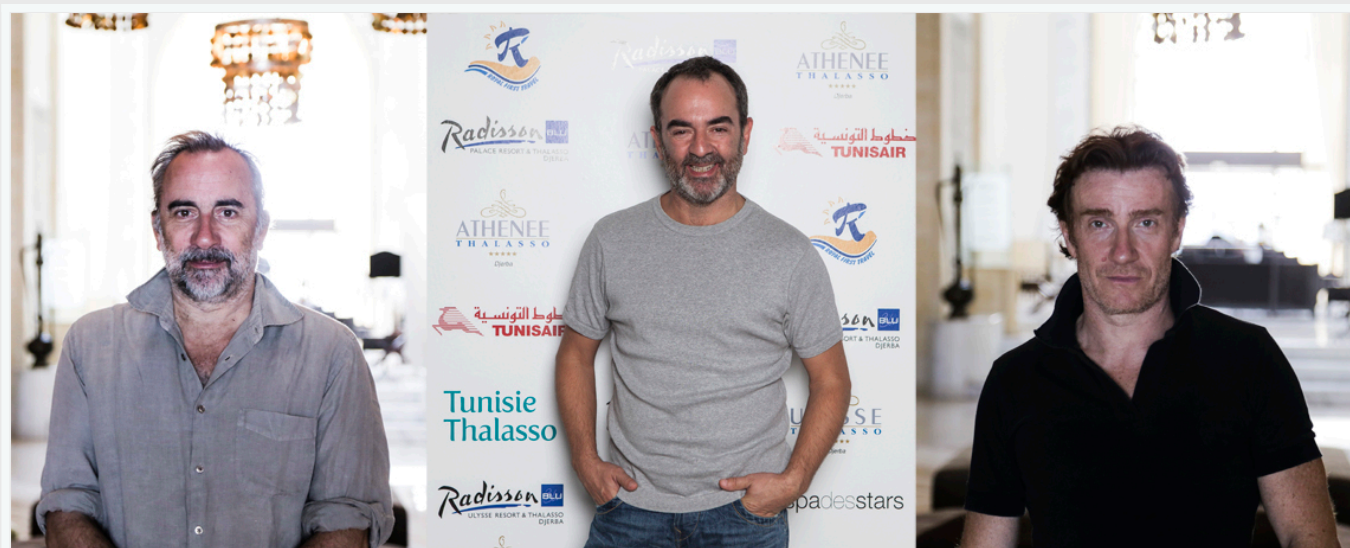
Antoine Dulery, Bruno Solo et Thierry Frémont au Radisson Blu Palace, Djerba.

Partagés entre l'envie de profiter du soleil radieux et celle de tester la large palette de soins des centres Ulysse et Athénée Thalasso & Spa, les invités ont aussi apprécié les grandes tablées servies en terrasse, au cœur du mois de novembre. Quelques-uns ont même demandé à prolonger leur séjour.