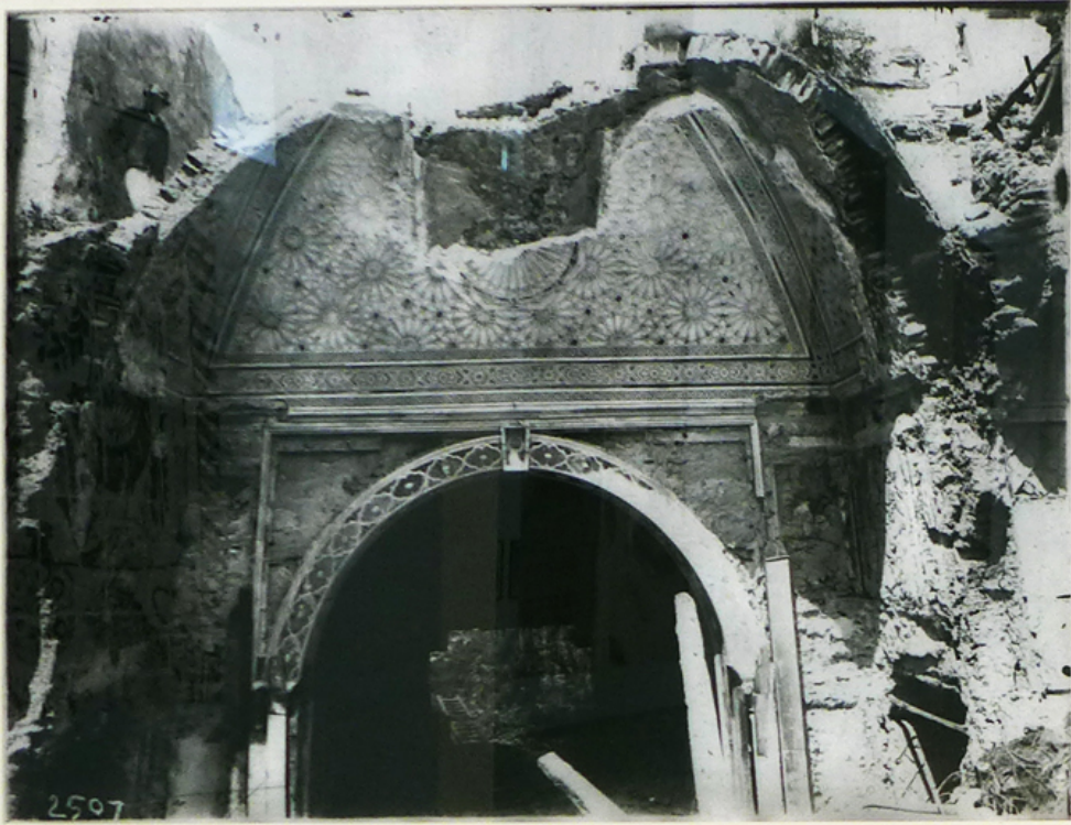
Les tombes du palais, 1825-1886