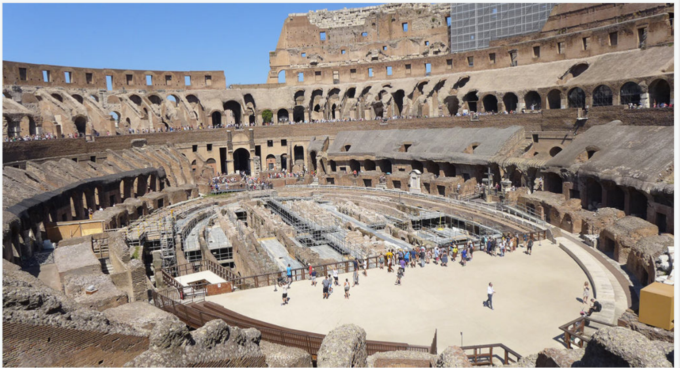
Le Colisée d'El Jem