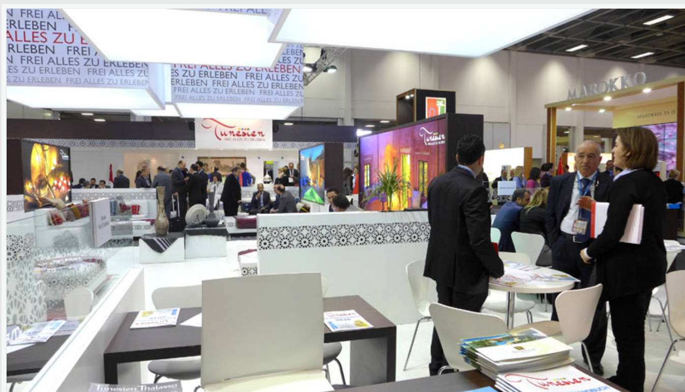
Le stand de Nouvelair.