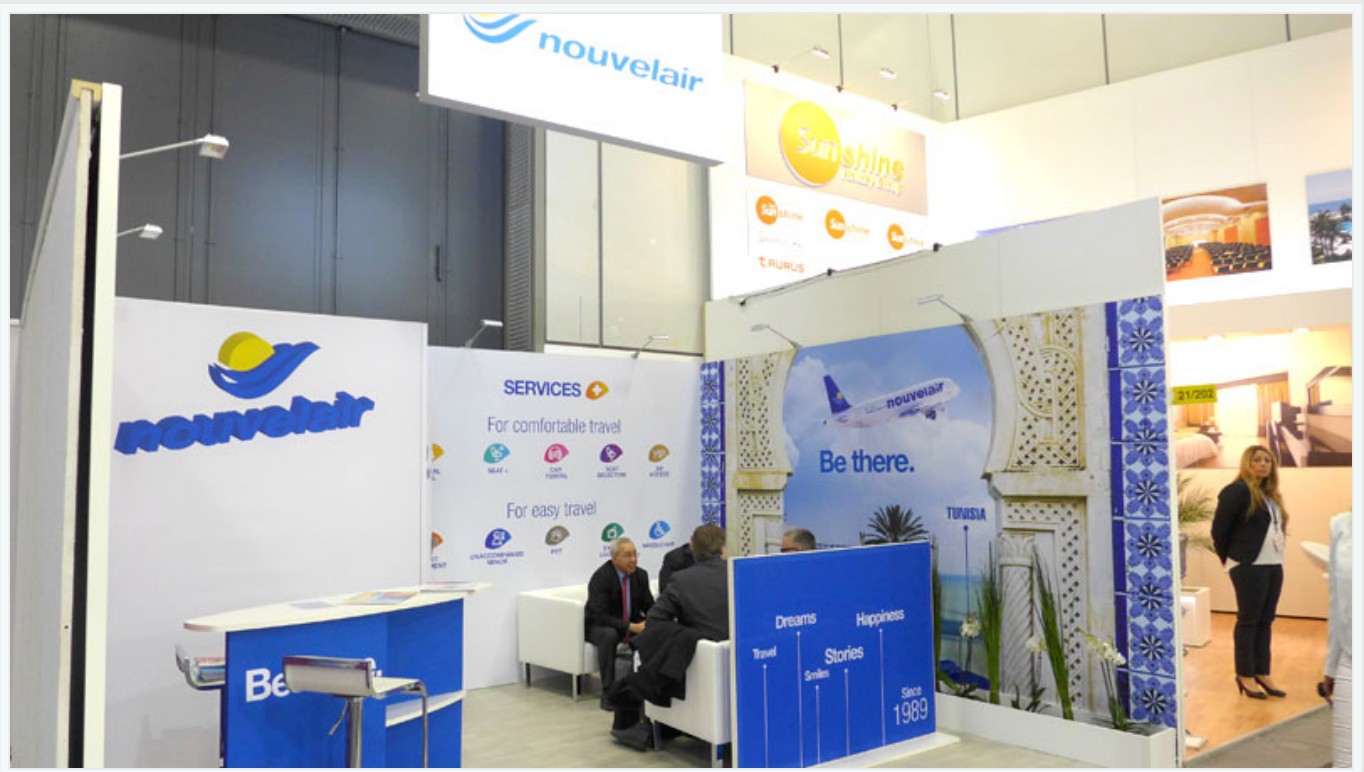
Le stand de Tunisair.