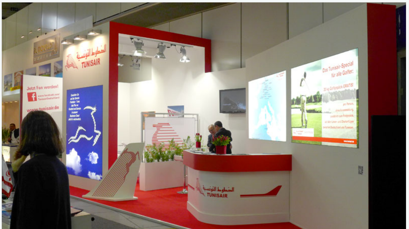
Le stand du groupe El Mouradi.