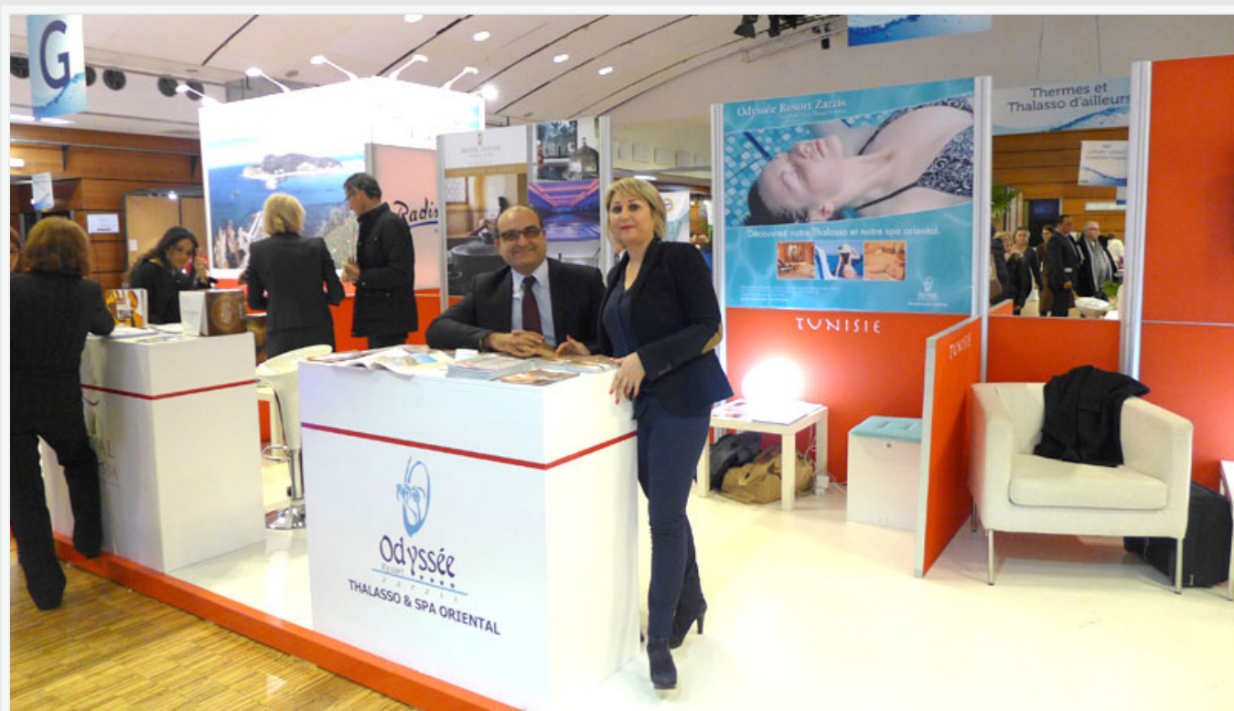
Le stand Odyssee Thalasso & Spa Oriental (Zarzis)