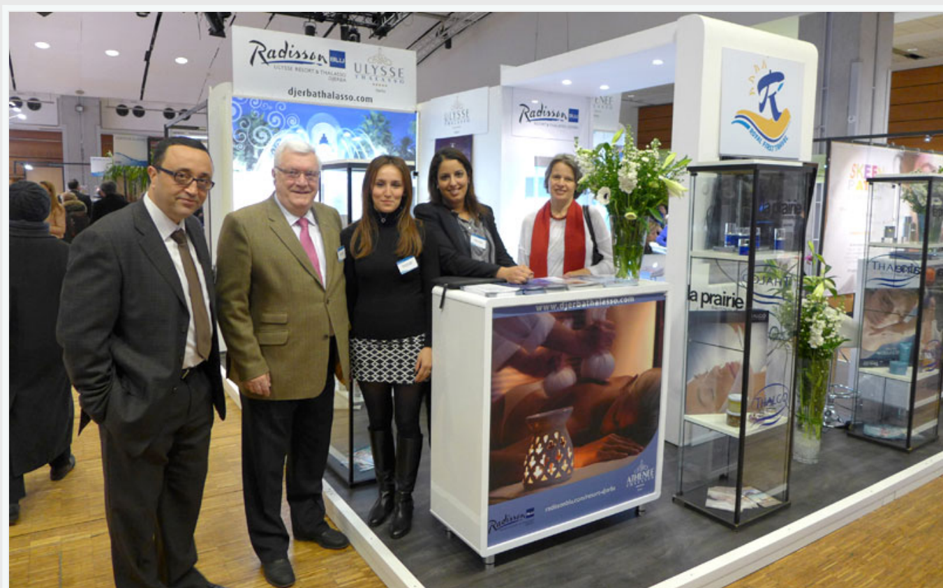
Le stand des centres Ulysse et Athénée Thalasso & Spa (hôtels Radisson Djerba)

Plusieurs centres tunisiens avaient leur propre stand : Ulysse et Athénée Thalasso & Spa, Hasdrubal Thalassa, Mövenpick Sousse, Royal Thalassa Monastir. D'autres étaient présents sur le stand habituel de la Tunisie, dû à l'Office du thermalisme : l'Odysée Thalasso Spa Oriental Zarzis, The Residence Tunis, Radisson Blu Hammamet, le groupe El Mouradi, Royal Kenz, les hôtels Marhaba, Alhambra Thalassa, ainsi que l'ONTT. Le nouveau guide Tunisie Thalasso a été largement diffusé sur le salon.