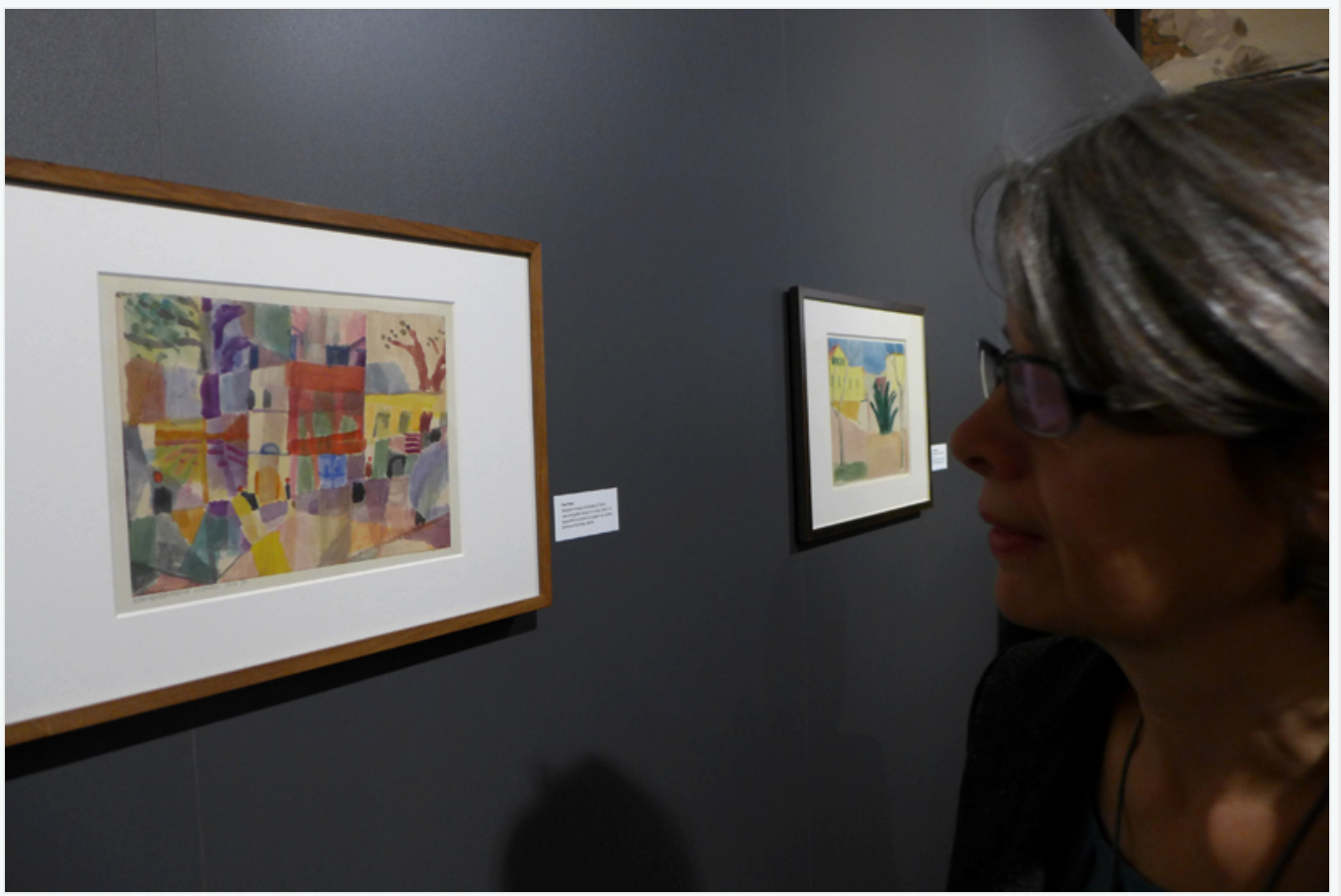
August Macke, "Marchand de bijoux turc" (1914).