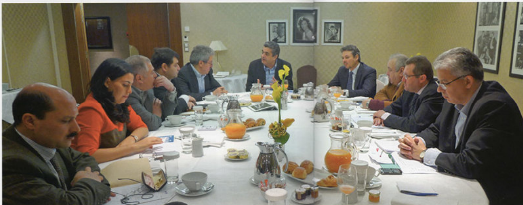
Table ronde Les TO tunisiens en France : leur diagnostic, leurs solutions

S'il n'y avait qu'un reproche à faire au tourisme tunisien, ce serait de n'avoir suscité que peu de vocations dans le tour-operating. Contrairement à nos concurrents comme la Turquie, dont les principaux TO dans de nombreux marchés sont d'origine turque, les TO tunisiens, malgré quelques succès, ne sont pas légion. Ceci explique peut-être que la Turquie reçoive aujourd'hui plus de trente millions de touristes et que nous n'en recevions que six. Le marché français est assez symptomatique de cette faiblesse tunisienne. En effet, il y a quelques décennies, l'atomisation du tour-operating français et notre proximité linguistique et culturelle avec ce pays pouvaient laisser prévoir l'émergence de TO tunisiens capables de s'accaparer une grande part du flux touristique vers la Tunisie et de le développer. Pourtant, après des succès réussis dans les années 80 et 90, où des TO tunisiens comme Republic Tours ou Couleurs Locales ont pu un temps rivaliser avec les grands, ces TO disparaissaient au moment même où montait le TO turc Etapes Nouvelles, devenu en l'espace de quelques années leader sur la Tunisie. Manque de vision, d'appui financier ou simplement de volonté, les acteurs du tourisme tunisien ont toujours préféré l'investissement dans le