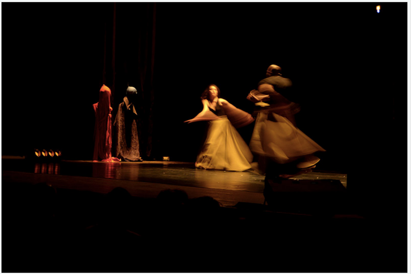
La salle rénovée du Centre culturel de Houmt-Souk