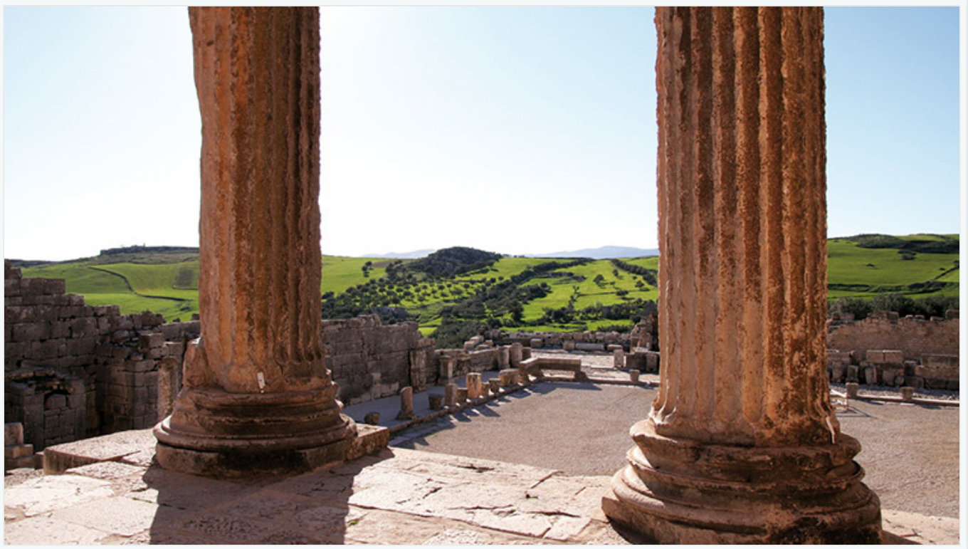
Le temple de Juno Caelestis