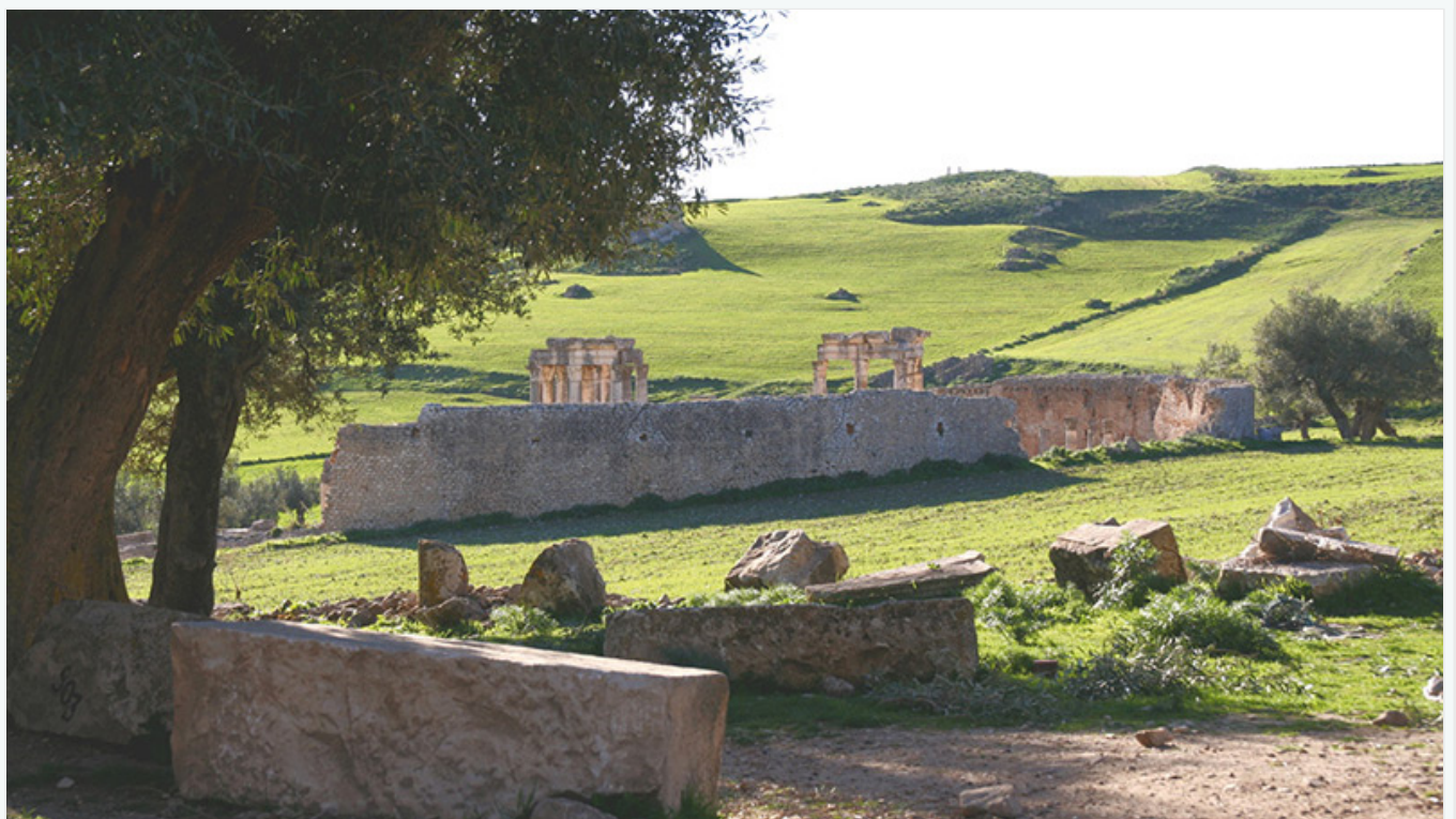
La restauration du mausolée numide