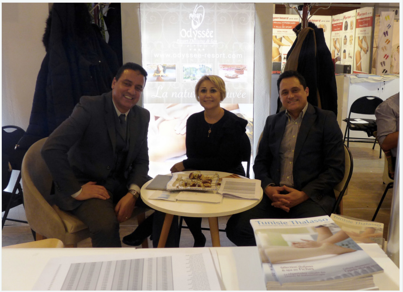
Le stand El Mouradi