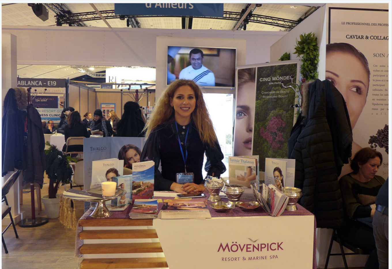
Vidéo promotionnelle de la thalassothérapie tunisienne diffusée par TunisiaTourism.info