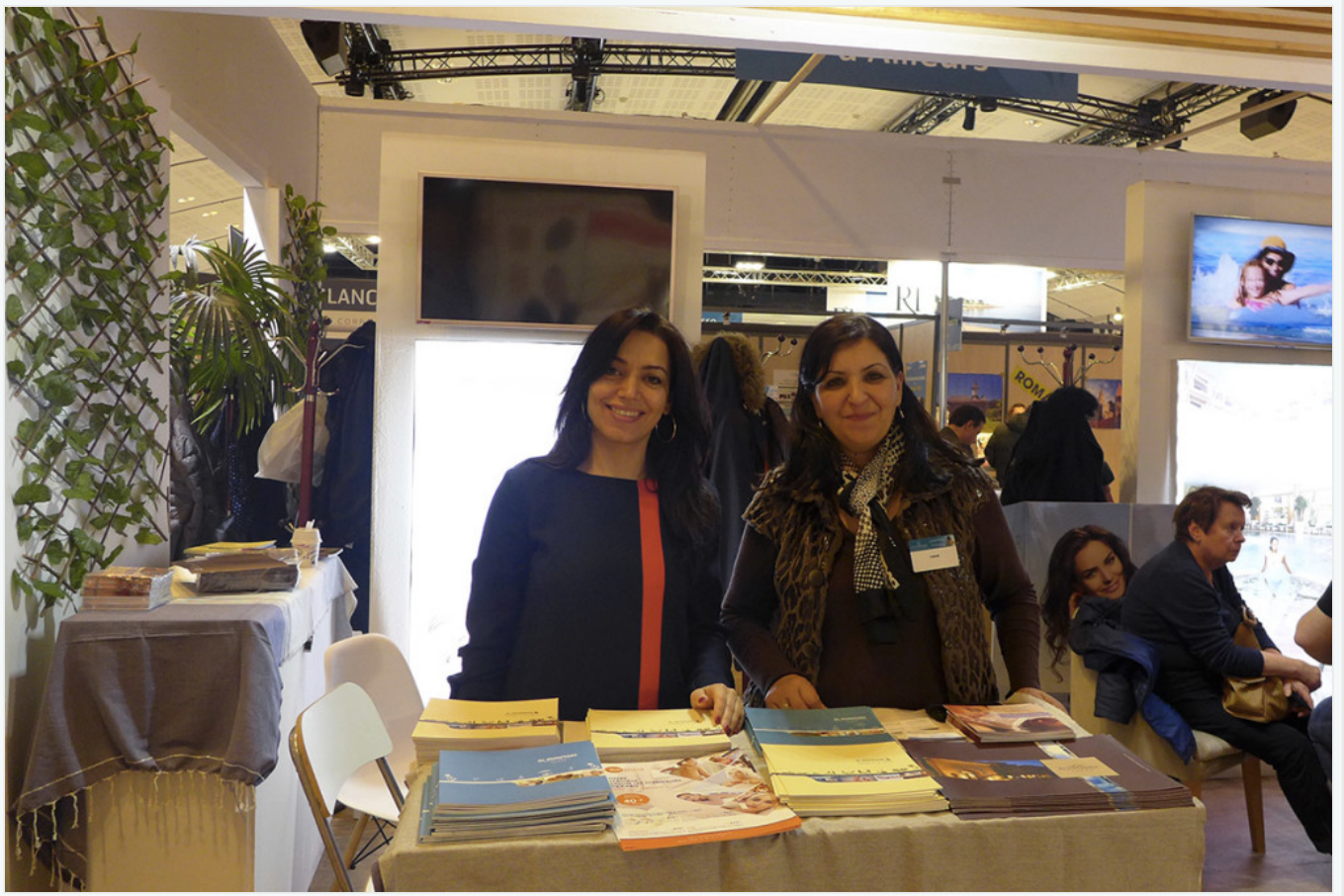
Le stand Mövenpick Resort & Marine Spa