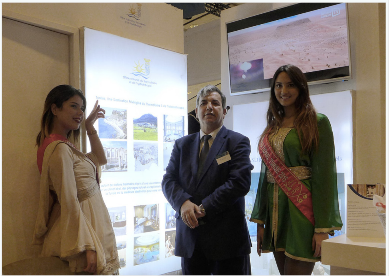
Le stand Athénée Thalasso / Radisson Blu Palace