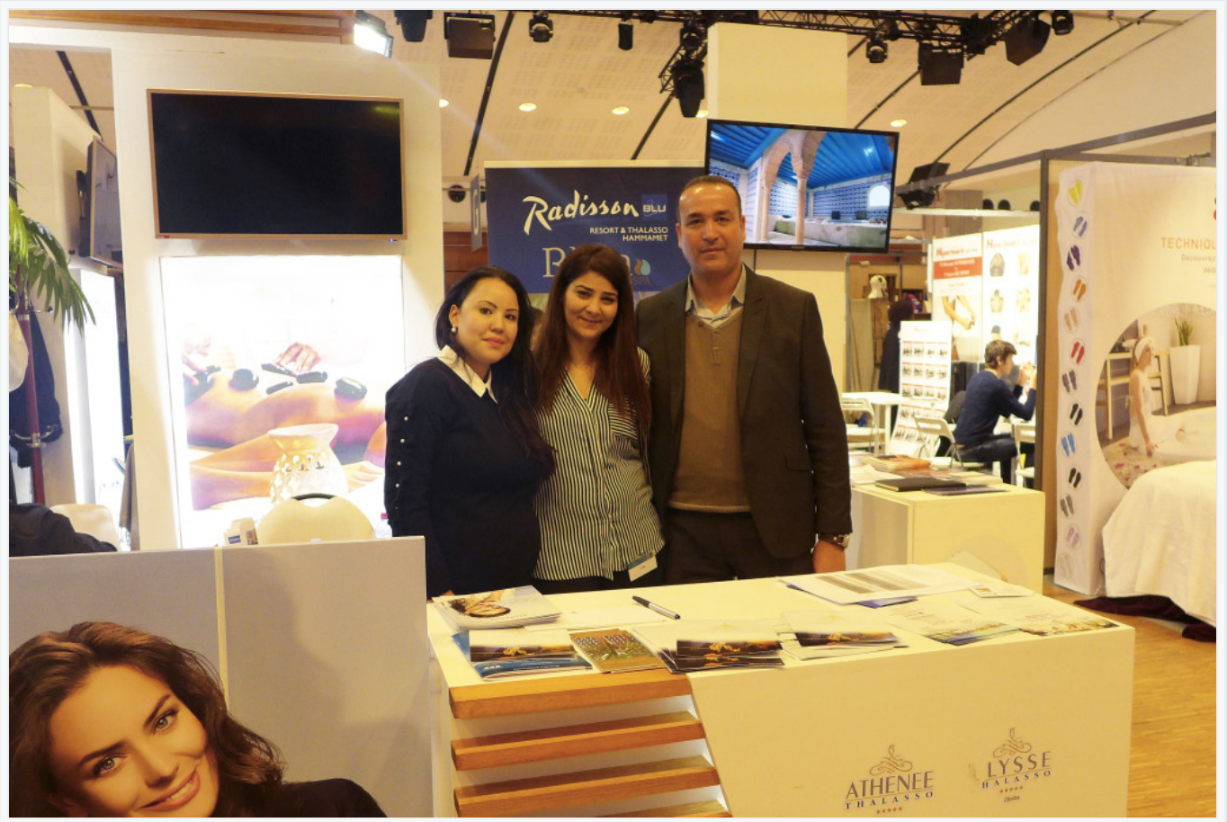
Le stand Odyssee Resort Thalasso & Spa