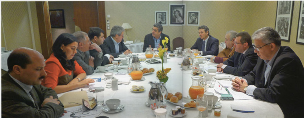
Table ronde Les TO tunisiens en France : leur diagnostic, leurs solutions

S'il n'y avait qu'un reproche à faire au tourisme tunisien, ce serait de n'avoir suscité que peu de vocations dans le tour-operating. Contrairement à nos concurrents comme la Turquie, dont les principaux TO dans de nombreux marchés sont d'origine turque, les TO tunisiens, malgré quelques succès, ne sont pas légion. Ceci explique peut-être que la Turquie reçoive aujourd'hui plus de trente millions de touristes et que nous n'en recevions que six. Le marché français est assez symptomatique de cette faiblesse tunisienne. En effet, il y a quelques décennies, l'atomisation du tour-operating français et notre proximité linguistique et culturelle avec ce pays pouvaient laisser prévoir l'émergence de TO tunisiens capables de s'accaparer une grande part du flux touristique vers la Tunisie et de le développer. Pourtant, après des succès réussis dans les années 80 et 90, où des TO tunisiens comme Republic Tours ou Couleurs Locales ont pu un temps rivaliser avec les grands, ces TO disparaissaient au moment même où montait le TO turc Etapes Nouvelles, devenu en l'espace de quelques années leader sur la Tunisie. Manque de vision, d'appui financier ou simplement de volonté, les acteurs du tourisme tunisien ont toujours préféré l'investissement dans le